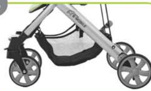
Versione a 4 ruote

Il passeggino sportivo ultraleggero è disponibile nelle versioni a 3 ruote o a 4 ruote.