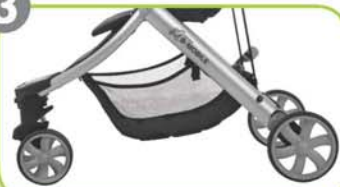
Versione a 3 ruote